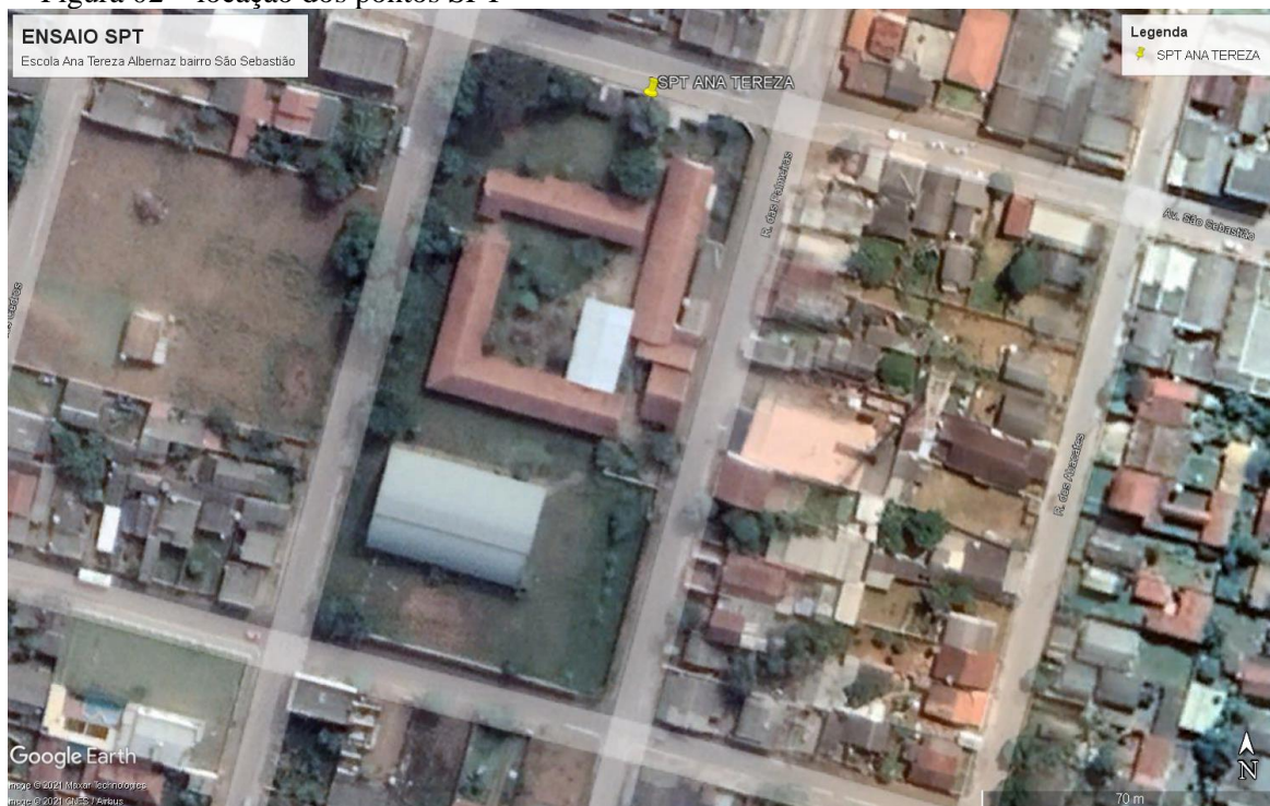
Figura 02 – locação dos pontos SPT